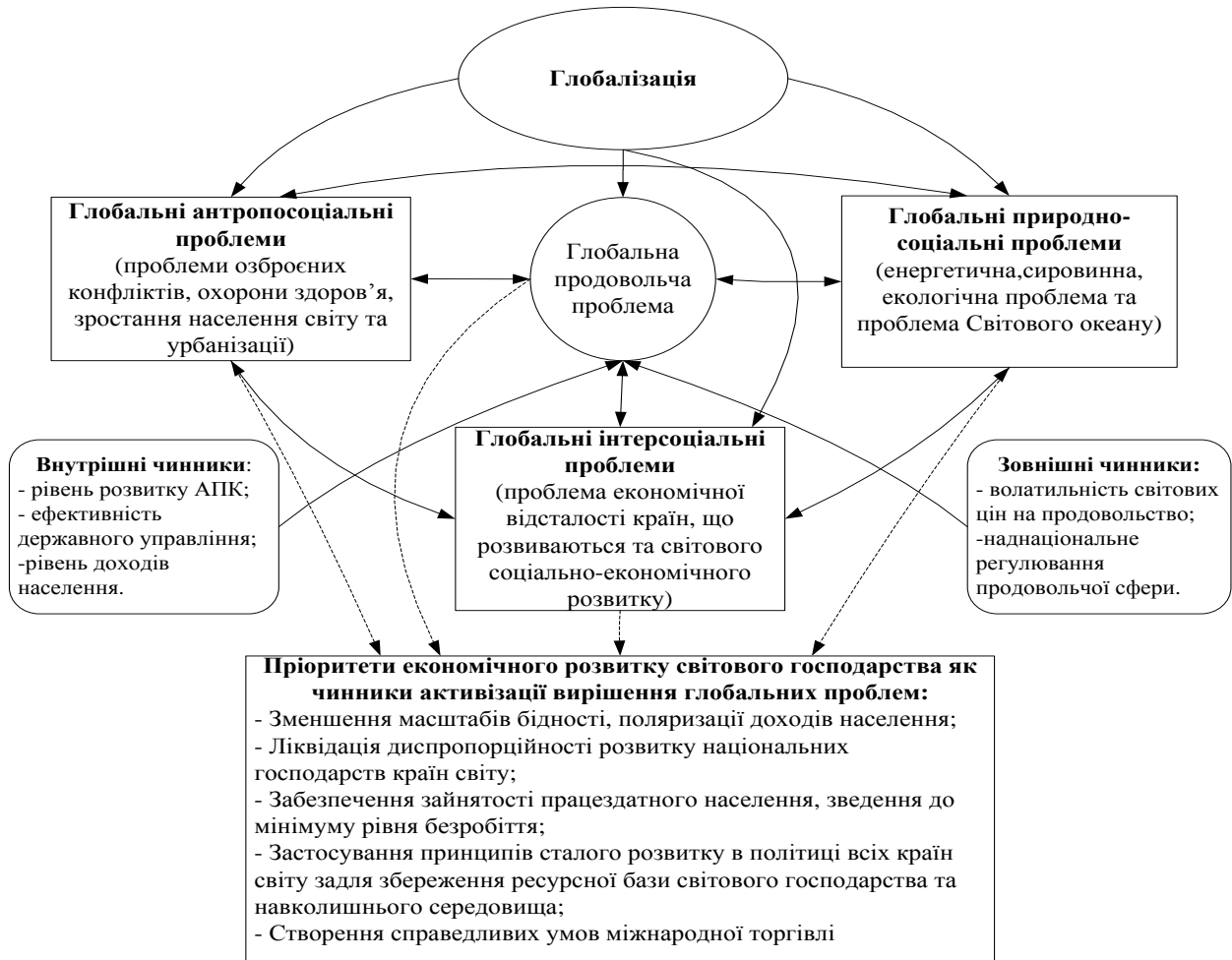
Рис. 2 Логіко-структурна схема глобалізаційної взаємодії в умовах посилення глобальної продовольчої проблеми (розроблено автором)

ресурсної бази світового господарства та навколишнього середовища; створення справедливих умов міжнародної торгівлі), досягнення яких зможе вирішити більшість світових проблем людства (рис. 2).