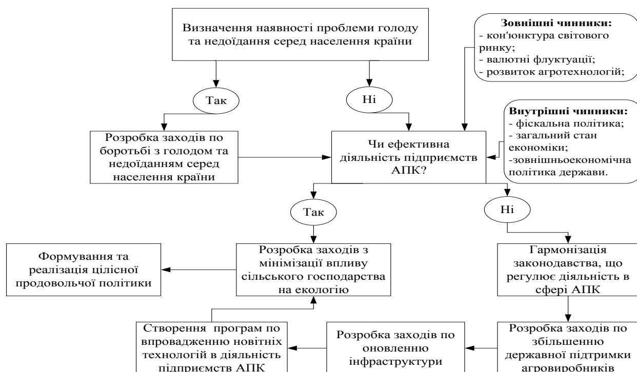
Рис. 3 Алгоритм формування продовольчої політики в умовах глобальної проблеми голоду та недоїдання (розроблено автором)

Встановлено, що продовольчі політики «нових агропродовольчих» країн потребують вдосконалення і врахування сучасних глобалізаційних факторів при їх формуванні. З метою удосконалення політик у сфері сільського господарства і продовольчого виробництва «нових агропродовольчих» країн розроблено алгоритм формування продовольчої політики в умовах загострення глобальної проблеми голоду та недоїдання (рис. 3), що включає п'ять послідовних етапів формування продовольчої політики та враховує основні заходи, необхідні для ефективного функціонування сфери виробництва та розподілу продовольства в межах держави у сучасних глобалізаційних умовах.