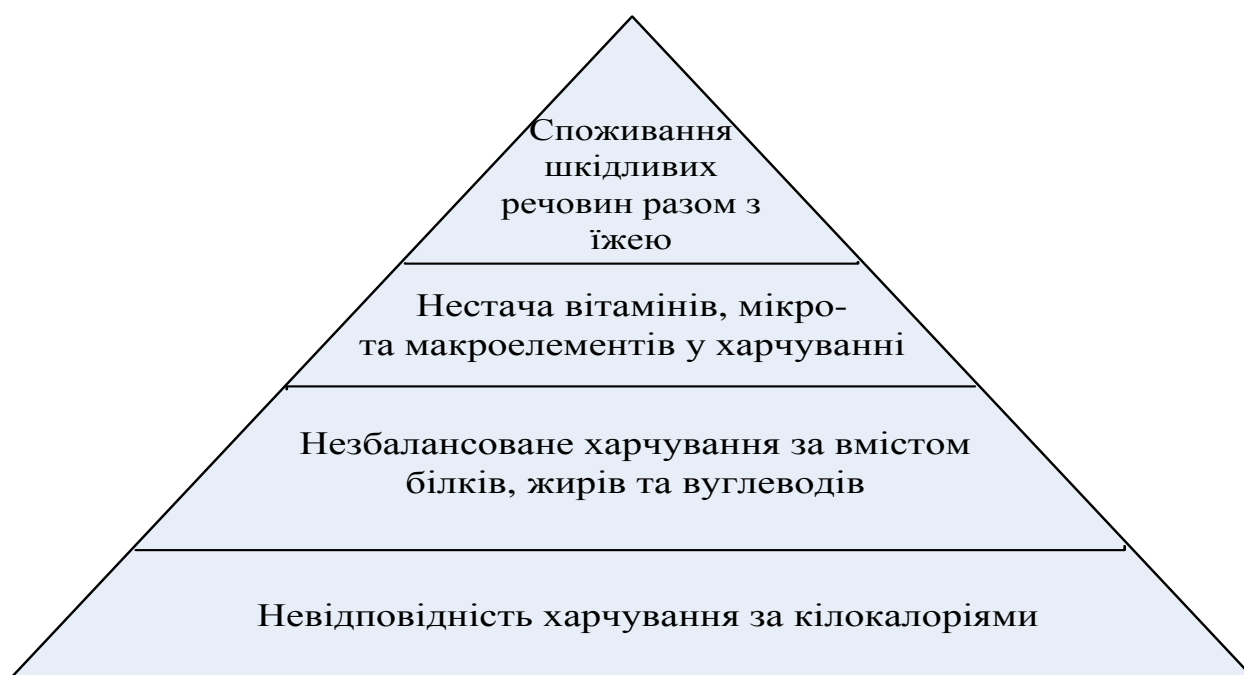
Рис. 1 «Піраміда» рівнів прояву глобальної продовольчої проблеми (розроблено автором)

У ході дослідження визначено рівні прояву глобальної продовольчої проблеми, що вказують на ступінь впливу на людське здоров'я та можливі негативні наслідки (рис. 1). Обґрунтовано, що на сучасному етапі до проявів глобальної продовольчої проблеми можна віднести «прихований» голод і споживання шкідливих речовин разом з їжею, які в умовах глобалізації набувають всесвітнього масштабу та становлять не меншу загрозу для здоров'я населення, ніж загальноприйняті складові: голод та недоїдання.