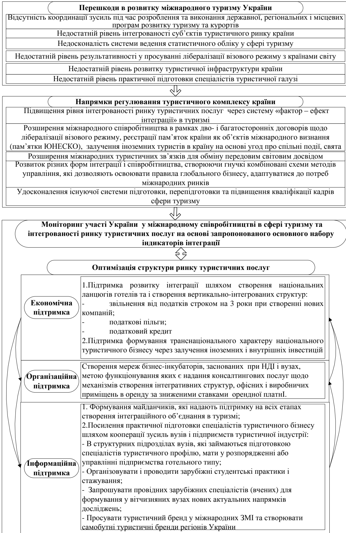
Рис. 3. Механізм удосконалення державної підтримки розвитку сфери туризму в контексті інтеграційних процесів (розроблено автором)