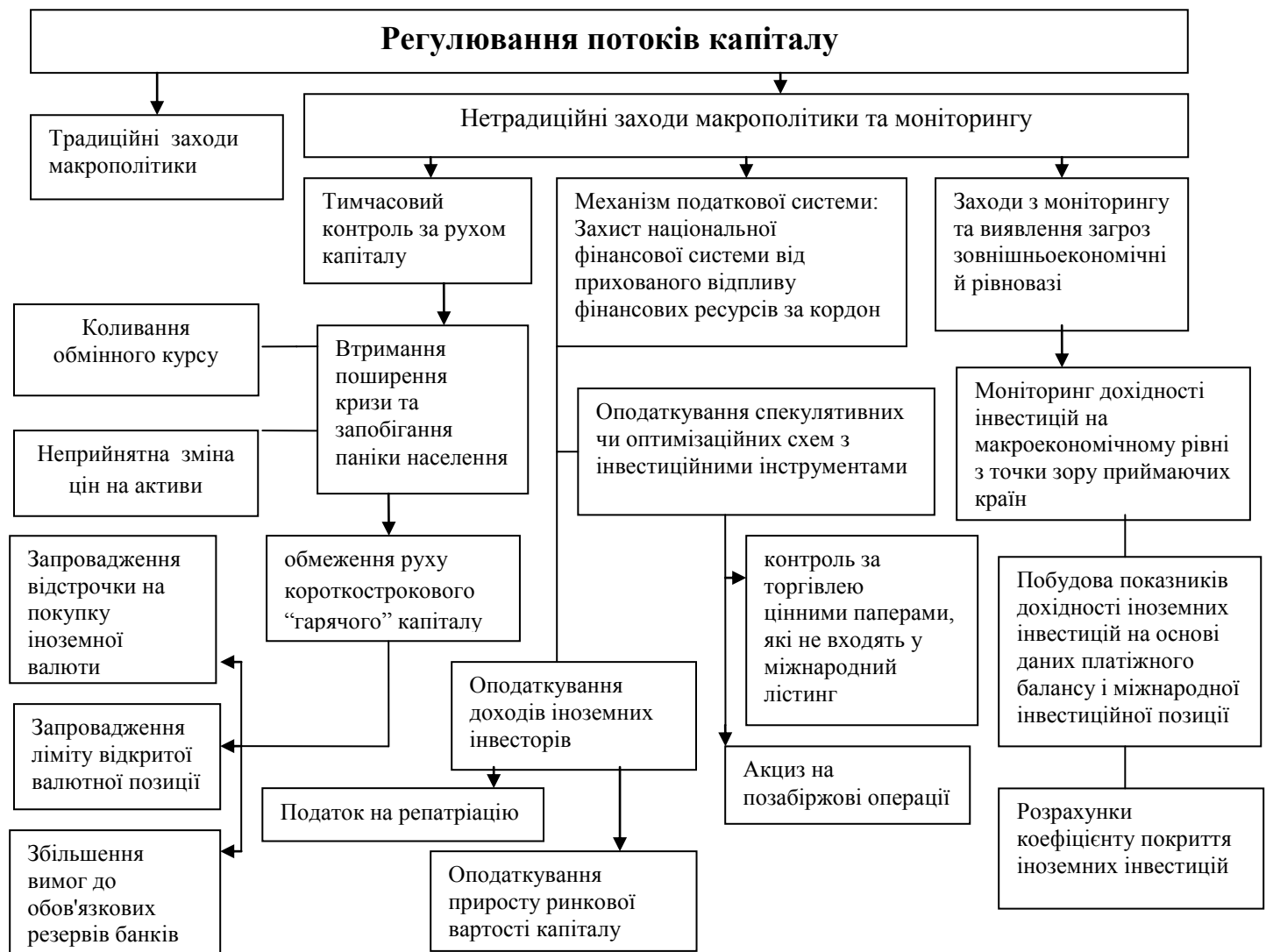
Рис. 2 Механізм реалізації державного регулювання потоків капіталу

На основі систематизації існуючих підходів до державного регулювання руху іноземного капіталу запропоновано механізм захисту національних економік від прихованого та раптового відпливу фінансових ресурсів за кордон. (Рис. 2). Обґрунтовано, що для зниження уразливості національних фінансових систем країн з ринком, що формується, до спекулятивних потоків капіталу доцільним є застосування заходів контролю над потоками капіталу; якщо в країні спостерігається значний прихований відплив фінансових ресурсів за кордон, необхідно посилювати захист національної фінансової системи шляхом податкового механізму.