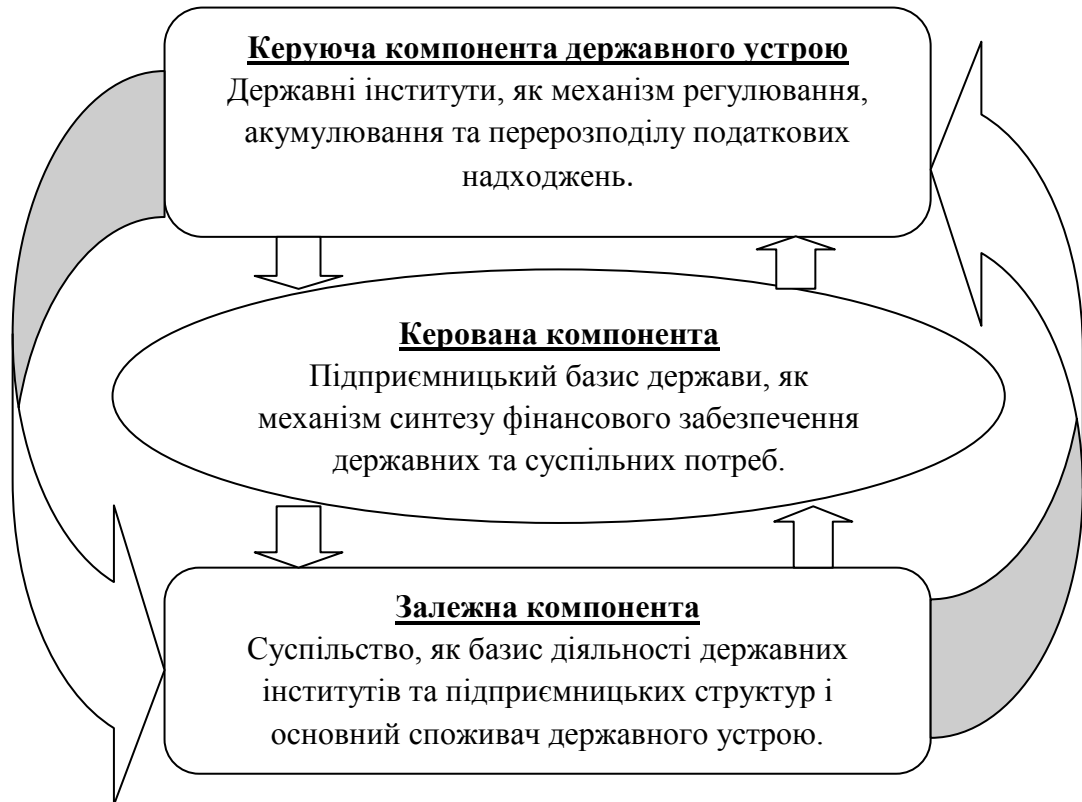
Рис. 1 Схема державної податкової архітектоніки

У результаті дослідження доведено, що використання податків є певним механізмом керування мікроекономічною архітектонікою за допомогою методів прямого і непрямого впливу, що дозволяє державним інститутам впливати на хід розвитку сучасного суспільства (рис.1).