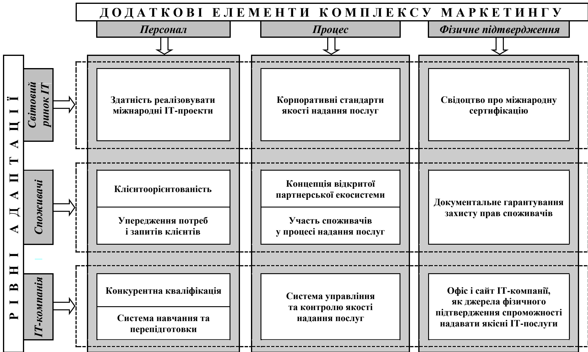
Рис. 4. Додаткові елементи комплексу міжнародного маркетингу сервісної ІТ-компанії*