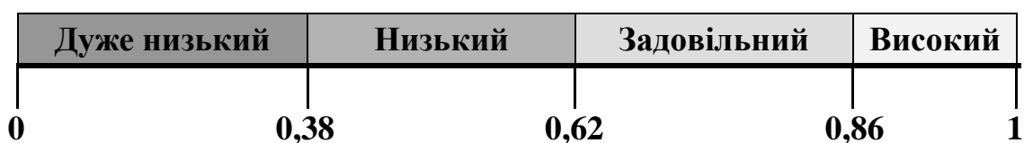
Рис. 2. Шкала оцінки ступеня готовності ІТ-компанії до виходу на світовий ринок інформаційних технологій*

Визначення ступеня готовності ІТ-компанії до виходу на світовий ринок інформаційних технологій запропоновано здійснювати на основі отриманої середньозваженої експертної оцінки з використанням спеціально розробленої числової шкали вимірювання (рис. 2), яка має градацію в пропорціях «золотого перетину», що відповідає різним ступеням готовності ІТ-компанії до виходу на світовий ринок інформаційних технологій.