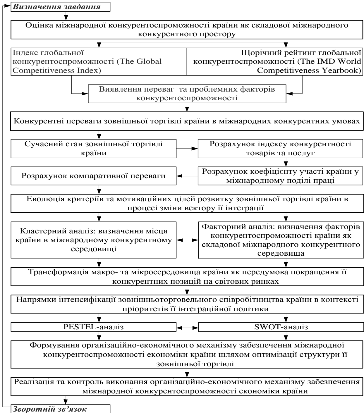
Рис. 1. Логіко-структурна схема дослідження міжнародної конкурентоспроможності країни [Розроблено автором]

За результатами дослідження запропоновано структурно-логічну схему (рис.1), яка включає поетапну послідовність дослідження зовнішньої торгівлі країни в забезпеченні її міжнародної конкурентоспроможності та базується на одночасному використанні сукупності методів теоретичних, аналітичних та прогнозних досліджень.