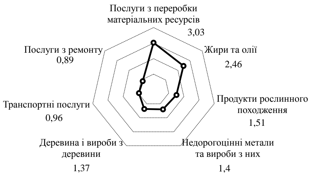
Рис. 2. Основні компаративні переваги зовнішньої торгівлі України на Європейському ринку за групами товарів та послуг, 2011-2017 рр. [Розраховано автором]

Зовнішня торгівля України на сучасному етапі характеризується поступовою зміною вектору на євроінтеграцію тому важливим є визначення компаративних переваг експортних груп товарів та послуг України. Результати розрахунку показника компаративної переваги для України за основними групами товарів та послуг в 2010-2017 рр. (рис. 2) підтвердили сировинний характер експорту України.