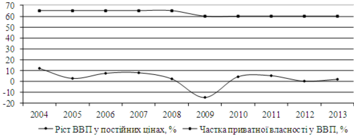
Рис. 1. Динаміка ВВП та частки в його виробництві приватного сектору економіки України (2004–2013 рр.)

від наявності сприятливих умов для діяльності суб'єктів господарювання.