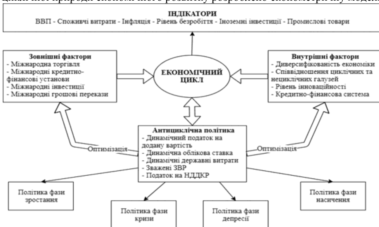
Рис. 2. Структурно-логічна схема політики стабілізації економічного розвитку*

З метою обґрунтування напрямків адаптації економіки України до циклічної природи економічного розвитку розроблено економетричну модель