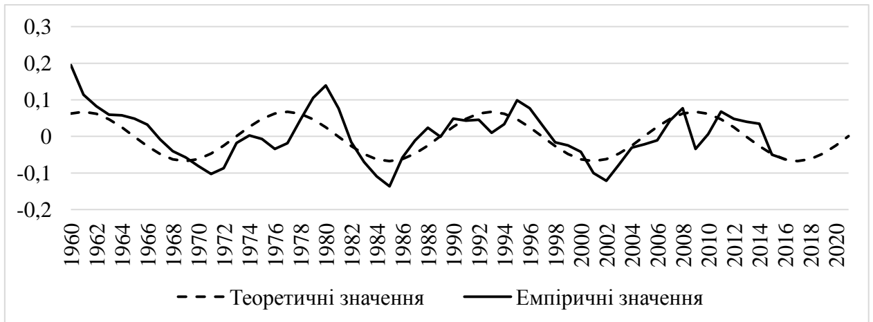
Рис. 1. Модель динаміки відхилень значення світового ВВП від довгострокового тренду, 1960-2021 рр.*

У процесі дослідження автором аргументовано, що динаміка розвитку світової економіки протягом досліджуваного періоду мала циклічний характер із явно вираженим 16-річним циклом (рис. 1). Циклічність економічної активності простежується в таких макроекономічних показниках, як темпи зростання ВВП, темпи інфляції, рівень безробіття, а також обсяги прямих іноземних інвестицій (ПІІ).