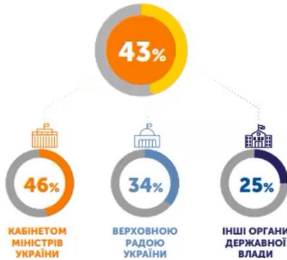
Рис. 2.3. Прогрес виконання Угоди про асоціацію органами державної влади України з 2014 по 2024 роки.