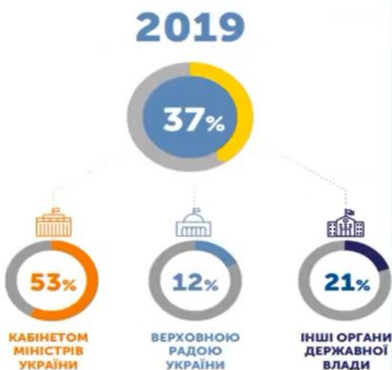
Рис. 2.1. Прогрес виконання Угоди про асоціацію органами державної влади України у 2019 році.