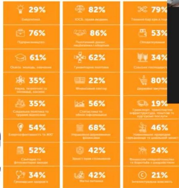
Рис. 2.4. Прогрес виконання Угоди про асоціацію по сферах з 2014 по 2024 роки станом на 01.01.2020 року.

Створення ПВЗВПТ є одним з найголовніших пунктів вищезазначеного документу і надає Україні можливість модернізувати свою економіку, розвивати та підвищувати конкурентоздатність вітчизняних МСП, змінити склад експортної продукції від сировини до продуктів виробництва, збільшити обсяг торговельного обороту, сприяти проведенню антикорупційних реформ, поліпшити бізнес-клімату в країні, залучати інвестиції, створювати робочі місця, запроваджувати інноваційні технології виробництва тощо.