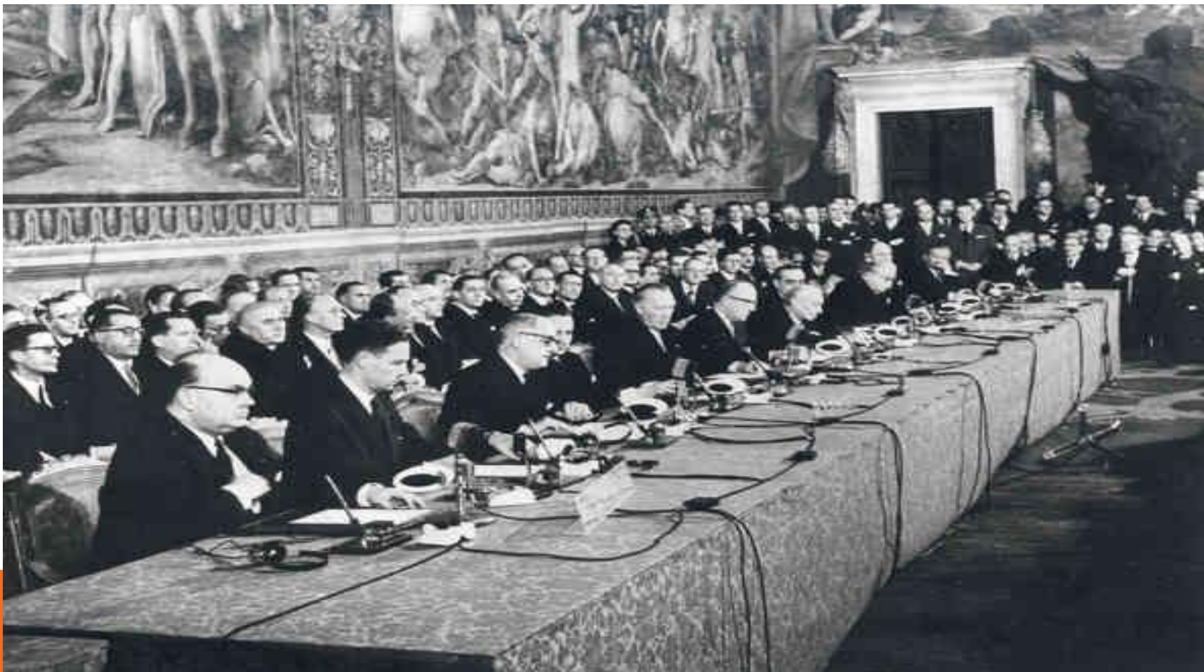
Signing of the EEC and EAEC Treaties 1957